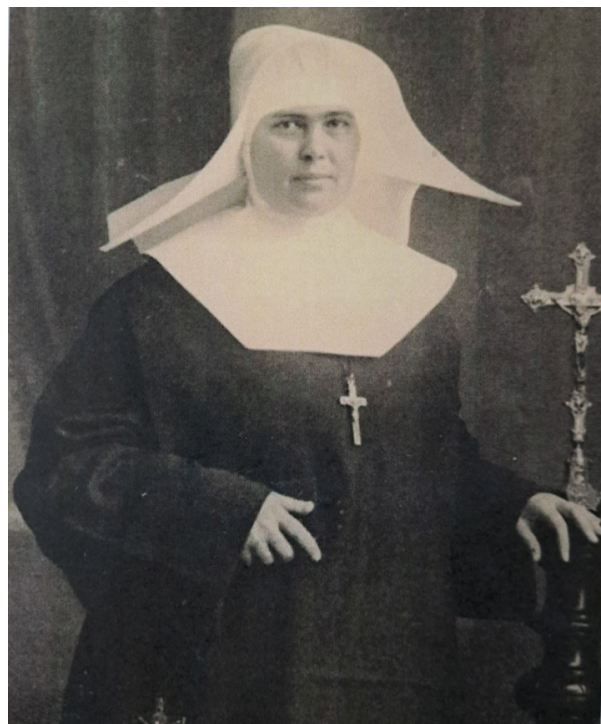
La Serva di Dio, il giorno della Professione religiosa.

Il 4 marzo 2007, nella cappella della Casa delle Suore Ospedaliere del Sacro Cuore di Gesù a São Gonçalo, è stato aperto il processo di Beatificazione e Canonizzazione, e lo scorso 23 marzo Papa Francesco l'ha dichiarata Venerabile.