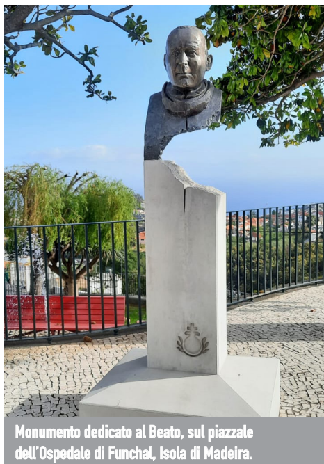
Monumento dedicato al Beato, sul piazzale dell'Ospedale di Funchal, Isola di Madeira.